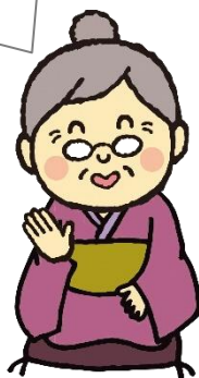
岩手県自殺対策キャラクター 「アイばあちゃん」

【内容】 講話 『あなたらしく働くために ～働き盛りのためのストレスケア講座～』 自殺予防の取組で大活躍されている精神科医師の講話