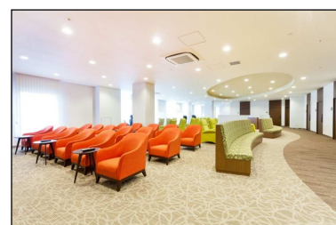
人間ドックフロア