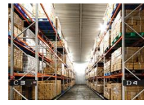
共同化設備の整備