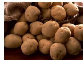
原料切替に伴う経費の一部負担