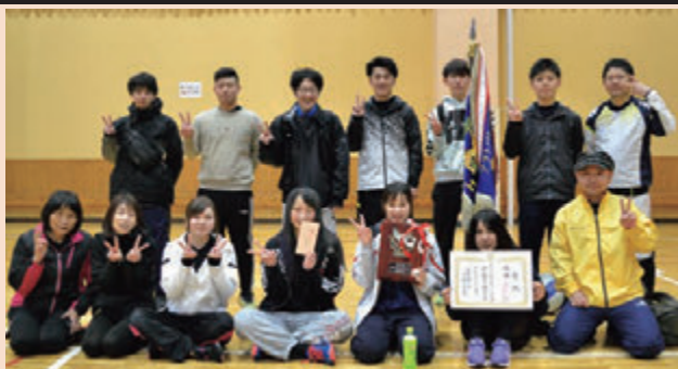
【優勝した(株)オサダ岩手事業所Aの皆さん】

来年度も開催を予定しております。従業員相互の親睦を深めるとともに、健康増進のため参加してみませんか？会員事業所の皆さまのご参加をお待ちしております。