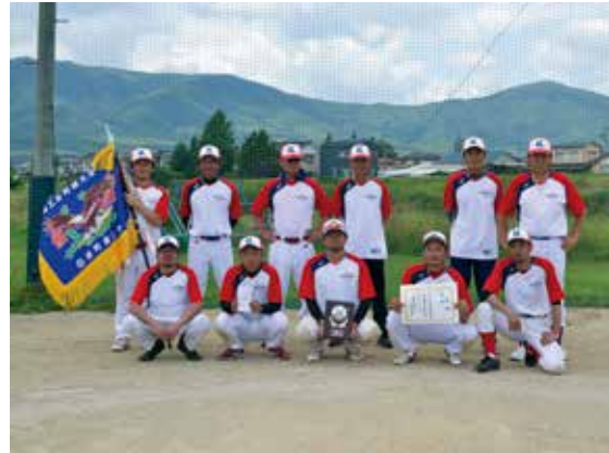
優勝した(有)寿工業の選手の皆さん