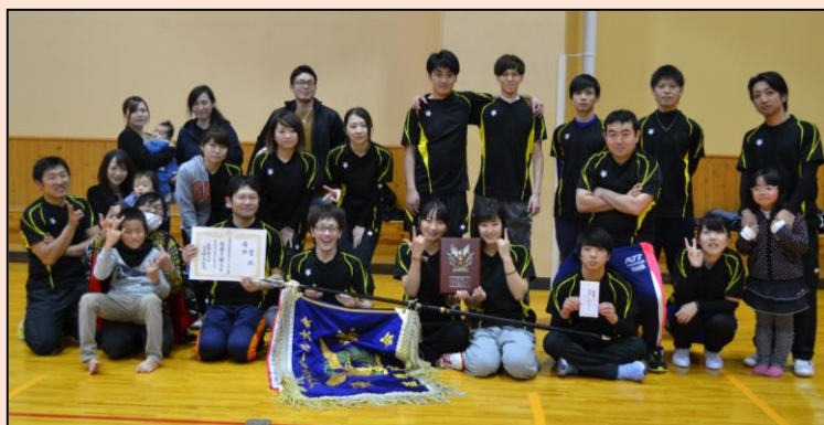
【優勝した(株)オサダ岩手事業所の皆さん】

来年度も開催を予定しております。今年度参加されなかった会員事業所の皆さまのご参加をお待ちしております。