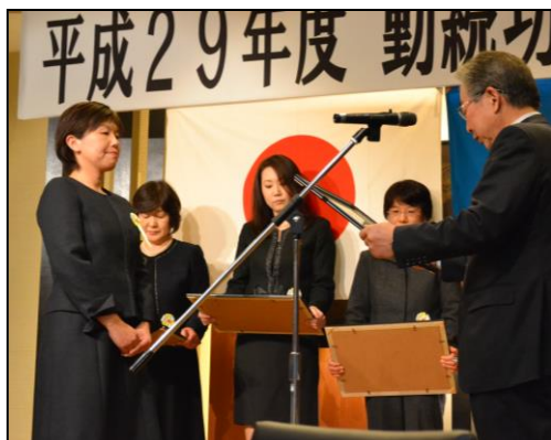
受賞者一人ひとりに表彰状と 記念品が授与されました。