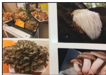
【天然キノコの写真】 自然大好き!!自然と共に生きる!!