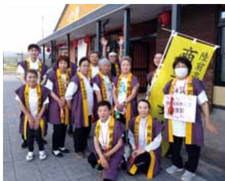
揃いの半纏で参加しました

令和7年7月19日、まちなか商店街にて開催された「チャオチャオ陸前高田道中おどり」に、女性部として参加しました。今年度は部員の他、有限会社食彩工房からも6名ご参加いただき、揃いの半纏姿で踊りを披露、楽しくお祭りを盛り上げました。