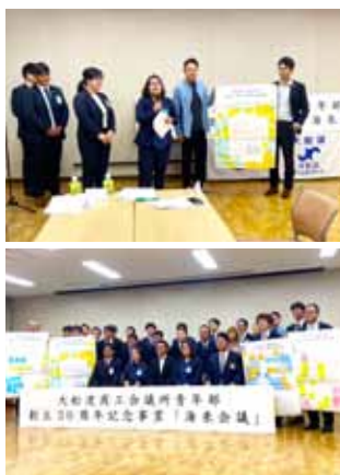
(上下)「海来会議」の様子

令和7年10月3日、大船渡商工会議所にて、大船渡商工会議所青年部、大船渡青年会議所、住田町商工会青年部、陸前高田青年会議所及び本会青年部5団体合同で、「海来会議」を行いました。本会からは4名出席し、気仙地区活性化のため、活発な意見交換を行いました。