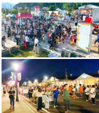
(上)餅まきステージの様子 (下)チャオチャオ陸前高田道中おどりの様子

令和7年7月19日、20日の2日間、まちなか商店街にて、お天王さま夏祭りを開催しました。本年度は、初めての試みとして、平成8年から続く「チャオチャオ陸前高田道中おどり」と併せて実施しました。夏めく日差しに照らされて、ステージイベントや地元事業者・露天商による屋台が街を彩りました。また、「チャオチャオ陸前高田道中おどり」では、夕暮れ色に染まる通りを、着物姿の踊り手たちが軽やかに舞いながら、受け継がれる伝統のリズムにのせて紡ぎました。二日間を通して街全体が活気に満ち、多くの笑顔で溢れる、華やかなお祭りとなりました。