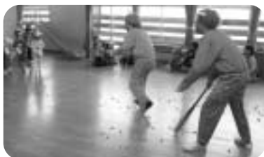
湯本保育園においての様子

去る2月3日、毎年恒例となっております節分行事「豆まき」のお手伝いとして、町内の保育所、「川尻」、「湯本」、「新町」、「せんだん」、「川舟」の5箇所を訪問いたしました。園児たちは突然現れた鬼役の青年部員に驚きながらも、大きな声で「鬼は外、福は内」と叫びながら豆まきを行いました。豆まきの後、園児から自分の悪いところを話してもらい、鬼さんに対し「これからは自分の悪いところを直します」と力強く約束を交わし、園児一人一人にプレゼントを手渡しました。