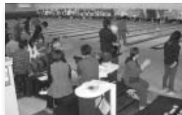
ボウリング大会の様子

去る、1月18日(日)に盛岡市上堂の「マッハランド」において恒例の企業連ボウリング大会が開催されました。