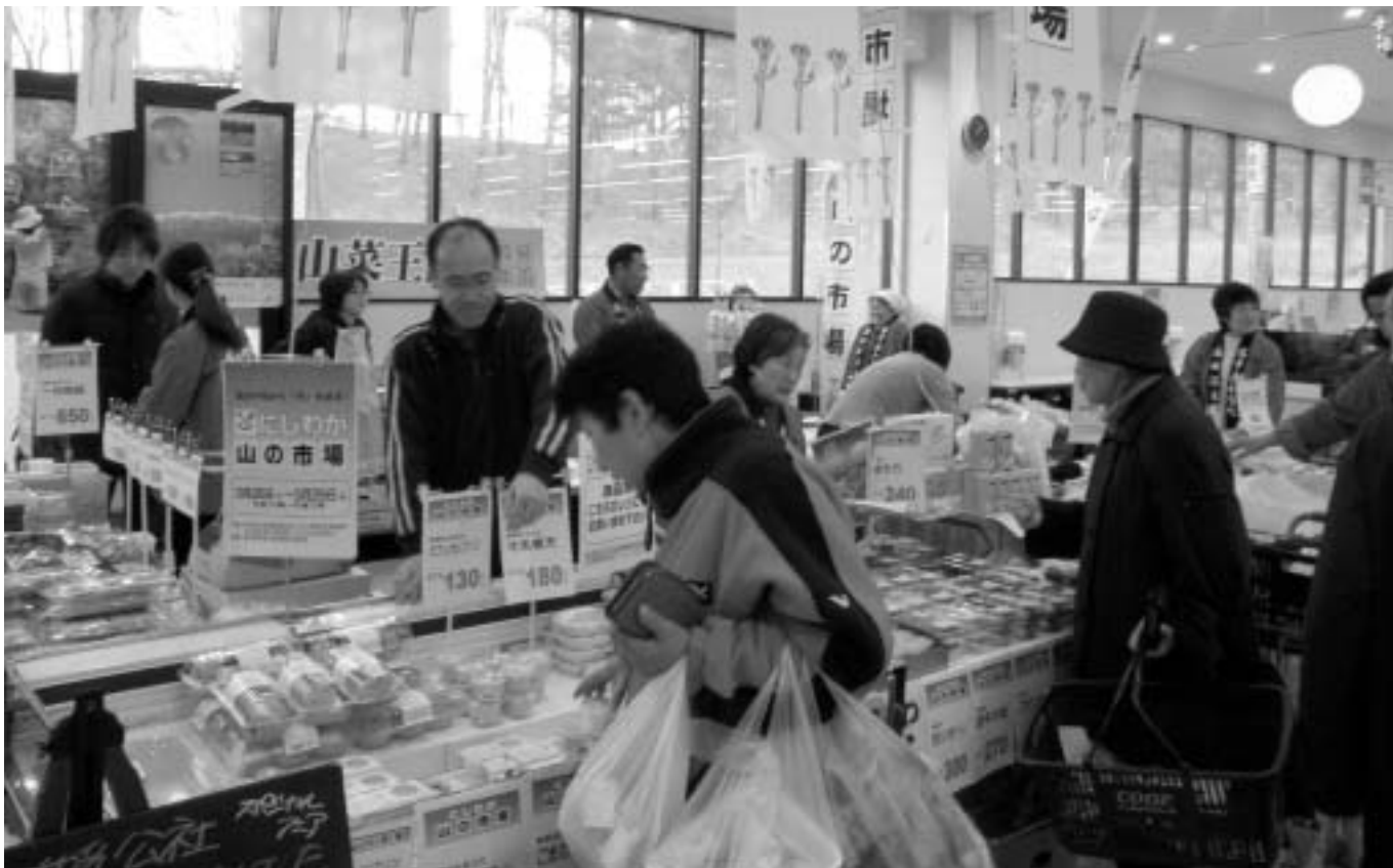
H21.3.28~29 にしわが山の市場

本所 〒029-5512 和賀郡西和賀町川尻40-73-11 西和賀複合型商工会館 湯夢プラザ内 Tel 0197(82)2270・Fax 0197(82)2131 沢内支所 〒029-5614 和賀郡西和賀町沢内字太田2-81-1 西和賀町役場 沢内庁舎内 Tel 0197(85)2321(FAX兼)