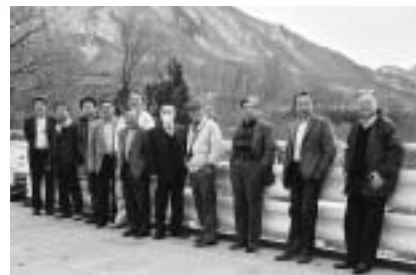
研修に参加された工業部会のみなさん

今年度の視察研修は建設業及び製造業関連に重点を置き3月8日(日)～3月9日(月)の1泊2日の日程で実施致しました。(参加者11名)