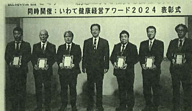
「いわて健康経営アワード2024」 表彰式（2025.1.8）の様子