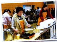
▲寒い中おつかれさまでした

「歳末たすけあいチャリティー」が安代地区体育館で行われ、荒沢地区二民三〇〇人が参加しました。十時頃から、販売コーナーでは手打ちそば、くるみ味噌汁などなどが販売され、お客様で賑わっていました。