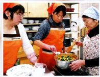
▲仕上げに味を整えましょう

ホームパーティーの料理講習会に参加できとても楽しかったです。作った事のない料理ばかりで大変勉強になりました。ホタテサンドキウイのソースなどはとても合いがキレイで美味しかったです。又、スイーツのパンナコッタは自分でも作って