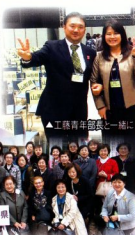
工務青年部長と一緒に