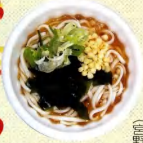
三陸産のわかめうどん

十月十二日から十四日まで、さくら公園にて山賊まつりが開催されました。例年と同じにうどんとチャリティーバザーの出店でした。今回の天候は……。私は献血することもあつて十二日