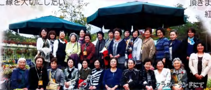
フラワーランドにて