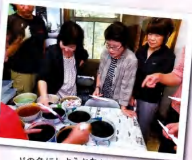
どの色にしようかなあ～

より工房は松川の氾濫で蒸気設備 に被害を受け二十日間休業しまし たが、関係者の強い熱意によりその後の 催事も染色教室も予定通り行われ ています。これからも繊細な染色作品 を通じ、新たな八幡平の自然を感じ たいと思います。(千田亜美)