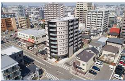
ケース01「技術サービス業」

<活用事例> 出典：中小企業庁「ミラサポ plus」( https://mirasapo-lus.go.jp/ )