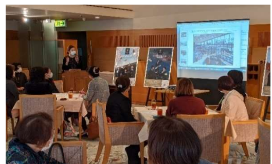
説明を熱心に聞く部員

当日は、建設中のハロウインターナショナルスクールの外観を見学したほか、(株)岩手ホテル&リゾート 小林ハロウ安比推進室本部長、羅都市計画事業本部長からプロジェクトの概要について、ご説明をいただきました。県内だけでなく、県外そして海外が注目するプロジェクトについて、お話を伺うことができた貴重な機会となりました。