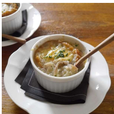
安比まいたけグラタン

カイハウスクラブに所属している料理研究家の先生方が八幡平市の食材を使ったレシピ開発とカイハウス料理教室の生徒を対象にしたオンライン料理教室を開催しています。