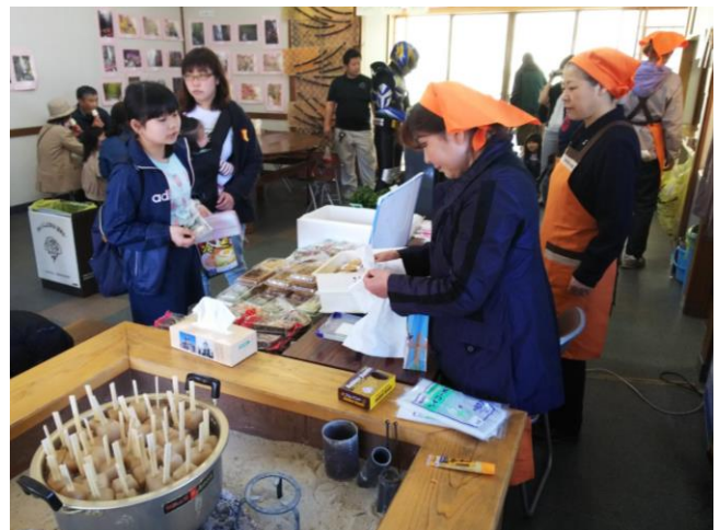
滝の茶屋内での女性部売店の様子