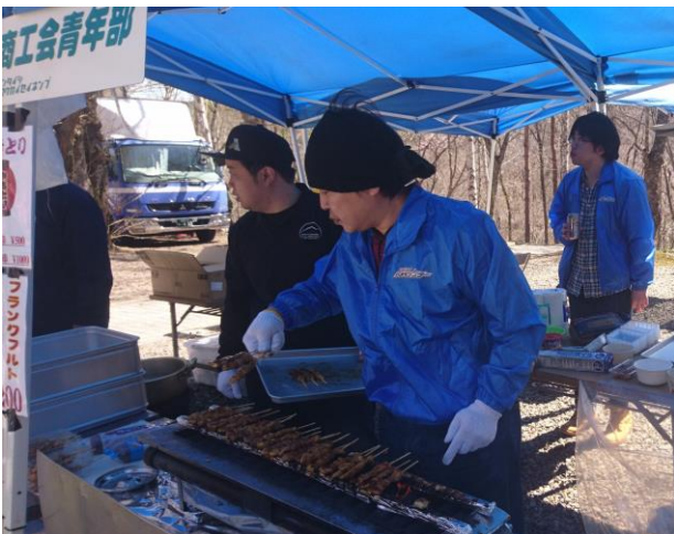
櫻松公園内での青年部売店の様子