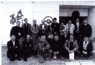
視察研修参加者(今世司酒造前)

各施策の積極的な活用、経営革新や創業・事業承継に係る事業計画の作成及びその着実な実施に向けて『伴走型支援』を強化！！