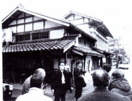
村上市 喜っ川店舗前にて