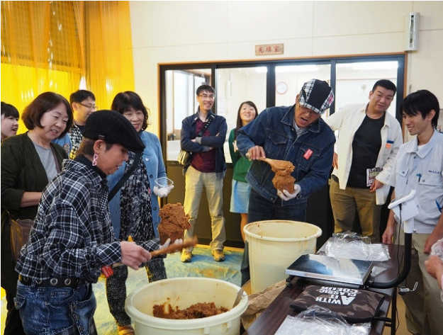
麴屋もとみや みそ作り体験