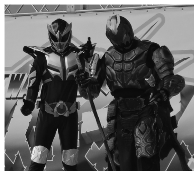
タイラーとマダラメのツーショット

14日には商工会青年部主管で「I W A T Eハチマンタイダイナマイト」が行われました。雨が時おり降り、天候に恵まれませんでしたが、地元八幡平市の「岩鷲護神ハチマンタイラー」のほか、テレビでおなじみのヒーロー「鉄神ガンライザーNEO」や「舞神双嵐龍（ブジンソーランドラゴン）」（茨城県つくば市）、西和賀商工会青年部の「護宝神ニシワガー」などローカルヒーロー6団体が大集結し、ショーを披露しました。