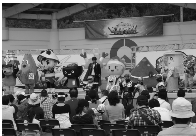
ゆるキャラ大集合！

会場内では、各ヒーローの限定ショップ、特産品の販売、前日に引き続いて産直の出店、全国ローカルヒーロースタンプラリーが実施され、イベントの最後には、オリジナルグッズが当たるお菓子まきも行いました。来場者数は6,000人と昨年よりも増え、大勢の子供連れが、地域活性化を担う全国のローカルヒーローの繰り広げる白熱のショーを楽しんでいました。