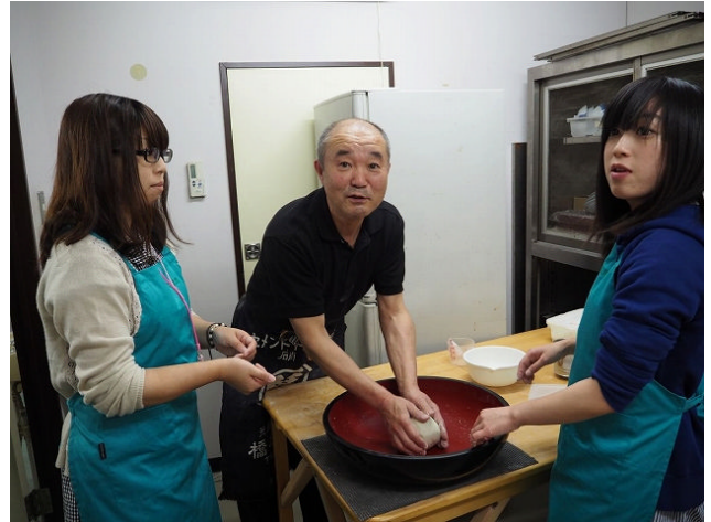
新安比温泉 静流閣でそば打ち体験

10月4日から5日の2日間、荒屋新町地区を会場に「ぶらっと一日体験工房まつり」を開催しました。お一人でも参加できるお得な体験工房(10/4)の開催やスタンプを揃えると安代の特産品が当たる「お買いものスタンプラリー」を行い、多くの来場者がありました。IGR銀河鉄道観光やめんこいTVの協力により、バスツアーも開催し、安代の観光を楽しんでいただきました。