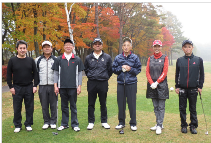
スタート前の皆さん(姫神山コースNo.1) 1

商工会員の相互交流と親睦を深めるため、商工会長杯会員交流ゴルフ大会が、10月25日南部富士カントリークラブで開催されました。