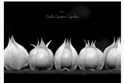
(今年から栽培している食用ほおずき)