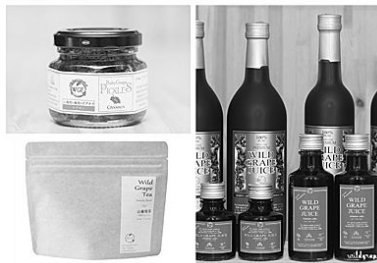
左上 ベイビーグレイプピクルス 左下 山葡萄茶 右 山葡萄ジュース