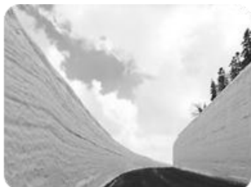
八幡平アスピーテライン 「雪の回廊」

日常の風景や自然、食べ物やイベント情報、地元の人など小さなものから大きなものまで、Facebook やブログ等のインターネットを中心に「勝手に」八幡平の情報を発信する倶楽部です。