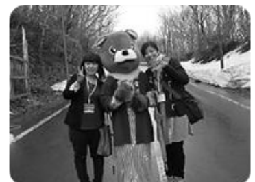
八幡平樹海ラインゲート前 はっちゃん

まずは、ぜひブログやFacebook をご覧いただければと思います。そして、コメントや情報提供をぜひお待ちしております！