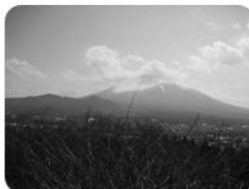
館山公園からの眺望