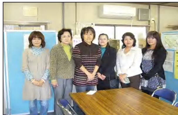
～ 大槌商工会仮事務所にて ～