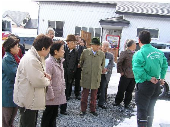
岩手エッグデリカ工場視察