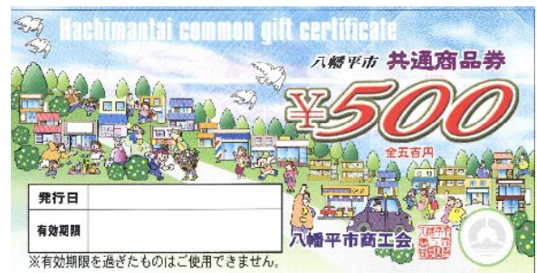
新しい商品券(見本)