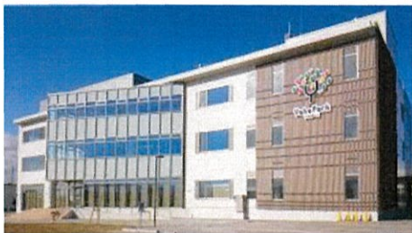
矢巾町活動交流センター 「やはばーく」

～ 矢幅駅前開発と岩手医科大学移転による新たなまちづくりに取り組んでいる矢巾町にお越しください ～