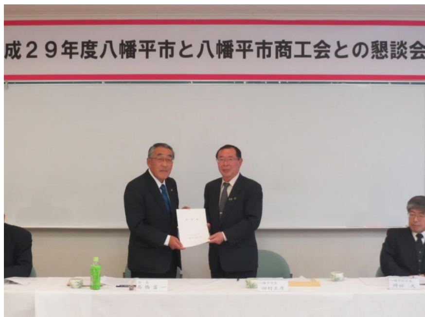
市長に要望書を手渡しする高橋会長

また、大更駅前開発事業に関しては賑わい創出に繋がる提案を期待していると市長からコメントがありました。