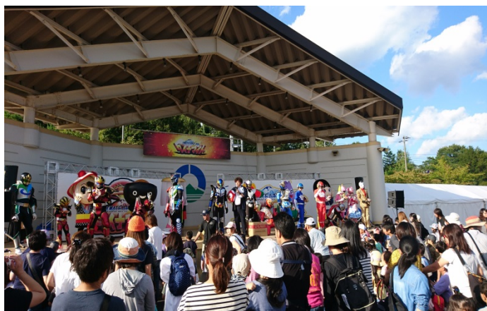
ステージ上に集合するヒーローとゆるキャラ達

会場内では、各ヒーローの限定ショップ、特産品の販売、全国ローカルヒーロースタンプラリーが実施され、イベントの最後には、オリジナルグッズが当たるお菓子まきも行いました。4400人のお客様が来場してくれ、大勢の子供連れが地域活性化を担う全国のローカルヒーローの繰り広げる白熱のショーを楽しんでいました。