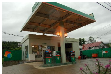
竜ヶ森サービスステーション