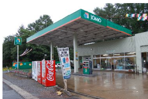
安比八幡平サービスステーション