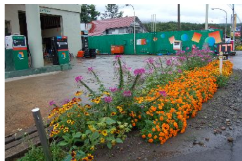
店頭には花を植えてきれいなお店づくり