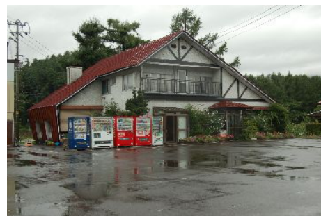
竜ヶ森ドライブイン

営業時間 ドライブイン竜ヶ森 11時～15時 竜ヶ森サービスステーション 8時～19時 安比八幡平サービスステーション 7時～19時