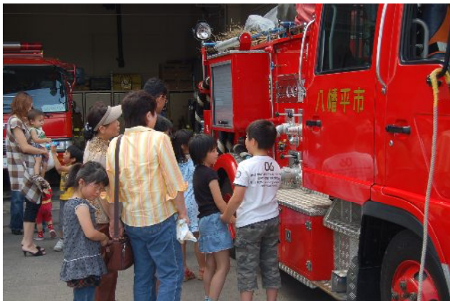
消防車に興味津々な子どもたち

去る6月21日(土)商工会館において、青年部による「子ども映画上映会」を実施しました。ハチマンタイラーも出動した上映前の火災予防訓練では、実際に消火器を使った消火訓練や、消防車・救急車を見学させてもらうなど、子どもたちは興味津々の様子でした。