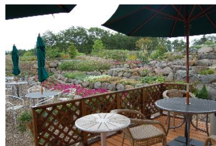
2500坪のサラダガーデン

お客様の満足を最重要視し、それを基本とした新商品の開発に力を傾注し、更に「現場・現実・現物」の三現主義を徹底することで、お客様のニーズにお応えして参りました。その継続が新たな需要をも創造していくことと考え、その役割を今後も担い続けていくことを使命と感じています。