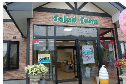
サラダファーム直売館

②直売館は新商品開発における貴重なご意見をいただける場にもなっており、今夏発売された「たまご屋さんのたまごとうふ」も実際のお客様の声から生まれた新商品となっております。